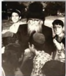
"ל"ב של ישראל" ירחי ישראל נגשים לקבל כריכות קדשו של רבינו ז"ע כסיומו של אחד הנסיעים של האגון י"ד איתמר שייסד כעיר אשדוד

במשך השנים נקשרו יהודים רבים מיוצאי גרוזיה אל רבינו ז"ע בעבותות של אהבה, והיו מהם שאף קבעו תפילתם בבית מדרשו של רבינו למרות שינויי הנוסחאות והמנהגים.