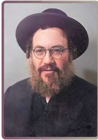
רבי בערל בצעירותו