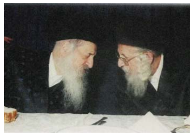
עם מרן פוסק הדור בעל השבט הלוי זצוק"ל

מוסיף ומספר בנו שליט"א כשנכנסו אצלו לבקר, אני ואמי ע"ה שמאד אכונג געבן (שמרה) עליו, והיתה רגילה לומר לאורחים שלא לשהות יותר מדי כי צריך הוא לנצל את הזמן, לפני כמה חודשים אחד סיפר לי שכשנכנסו אצלו אמי אמרה לו שלא לעכב אותו כי זמנו יקר מאוד. גם אמי עצמה לא הפריעה