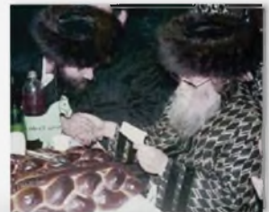
רבינו ז"ע בקריאת קיטול בשו"ה"ט פורים תשמ"ה