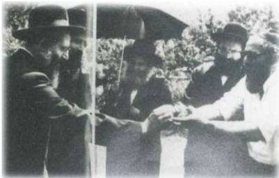
במסע השמיטה לחיזוק החקלאים נראים משמאל לימין: רבינו זצ"ל, גאב"ד קוממוית זצ"ל, וכ"ק האדמו"ר הפני מנחם מגור זצ"ל